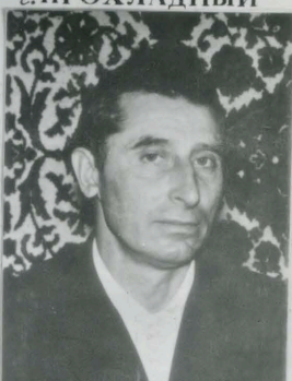
МАХОВИК С.М. 1931 г.р. ар. 22.05.86 г. г. ЧЕРНИГОВ